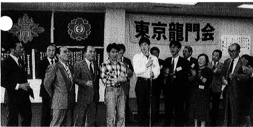
老若男女混成合唱団(?) オグメは合わず とも、この歌声は日本一!! (総会パーティーより)

上手下手を問わず碁好き者同志 がパチパチ・ワイワイの囲碁同好 会。年々好評です。(囲碁会より)