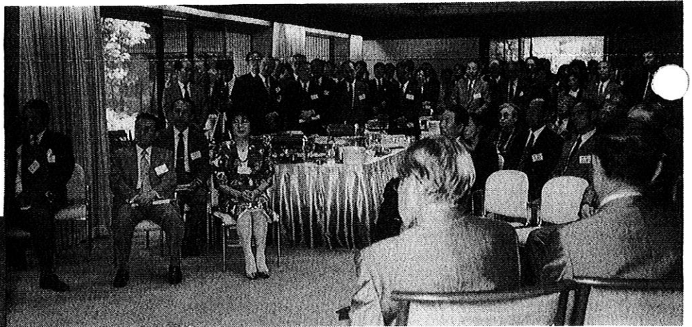
衆議院副議長公邸での 総会風景