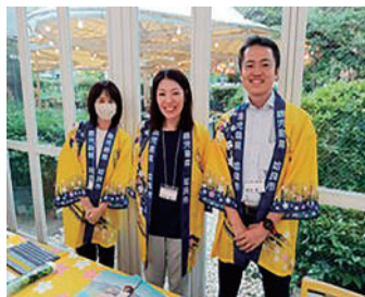
◇著者近影 (真ん中が私です)

加治木で生まれ、「柁城小↓加治木中学校↓加治木高校↓鹿児島大学」と、全て地元で通い続けた私が務めているのは「始良市役所」です。どれだけ地元が好きなんだと思われるかもしれませんが、今まで市外にさえも出ることなく過ごしてきた私ですが、なんと今は東京に住んでいます。実は、令和6年4月から鹿児島県(県庁)の東京事務所に、研修生としてお世話になっているのです。始良市から東京・永田町へ。人生で初めての住民票異動が、東京23区でした。そんな私の鹿児島県東京事務所での業務内容について少しご紹介したいと思います。